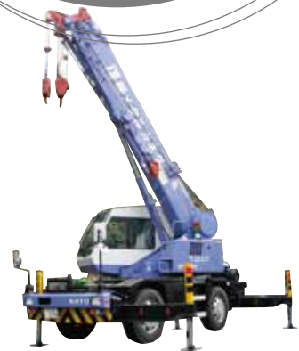
KATO 13tラフタークレー 屋根材・壁材の荷上げ荷降ろし作業に使用する。

当社はおお客様の緊急を要するご依頼に対応すべく、自社にてガルバリウム鋼板を在庫⇒オートメーションによる鋼板加工⇒施工と一環してできる設備・重機を備え、ノウハウを蓄えております。