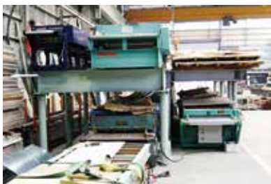
屋根・壁用各種成型機械