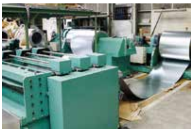
巾1200・巾1000 自動定尺切断機 コイル台に原板を載せ定尺に材料を 切断する。 切断材料 ・ステンレス ・亜鉛鉄板 ・ガルバリウム鋼板 切断能力 MAX 1.0mm