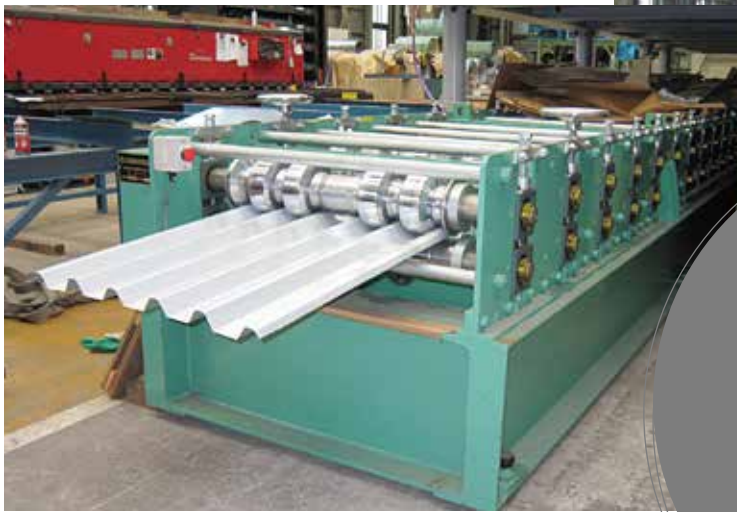
スレート波改修用カパールフ成型機械