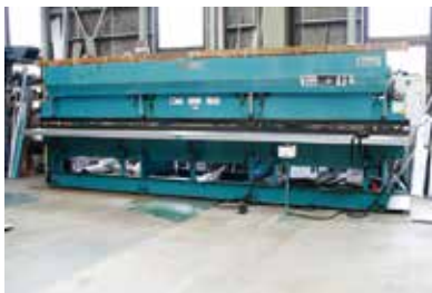
イリノ製 6m曲板機 主に水切・コーナー・ケラバ・棟の加工 あらゆる薄物加工が可能 性能 0.8ミリまでの曲げ加工が可能