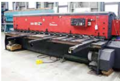
アマダ製 4.0mシャーリング 原板を必要寸法に切断する。 性能 厚さ4mm 長さ4m