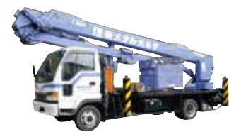
高所作業車（スカイマスター） 屈伸タイプの高所作業車 性能 地上25.5m 作業半径13m 壁施工時場所によっては、足場の変わりをする。 工場など昇降設備がない場所での作業として使用する。